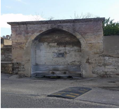
Resim 103: Gerdanlı Çeşme (Doğu Mahallesi)