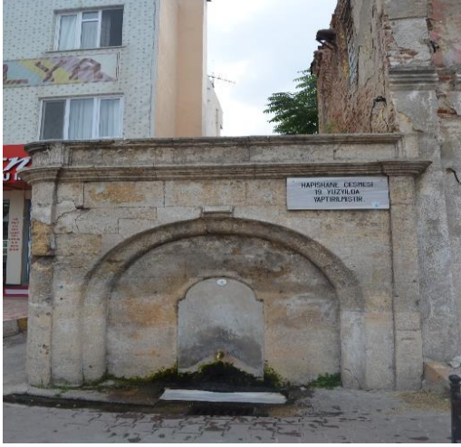
Resim 104: Hapishane Çeşmesi (Karakaş Mahallesi)