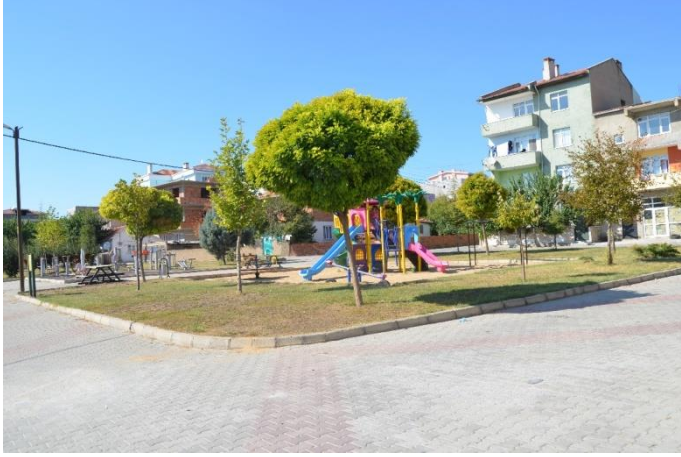
Resim 47: Badem Park / Çocuk Oyun Alanı / Spor Aletleri (Bademlik Mahallesi)