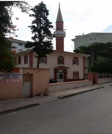
Resim 90: Karakaş Bey Cami (Karakaş Mahallesi)