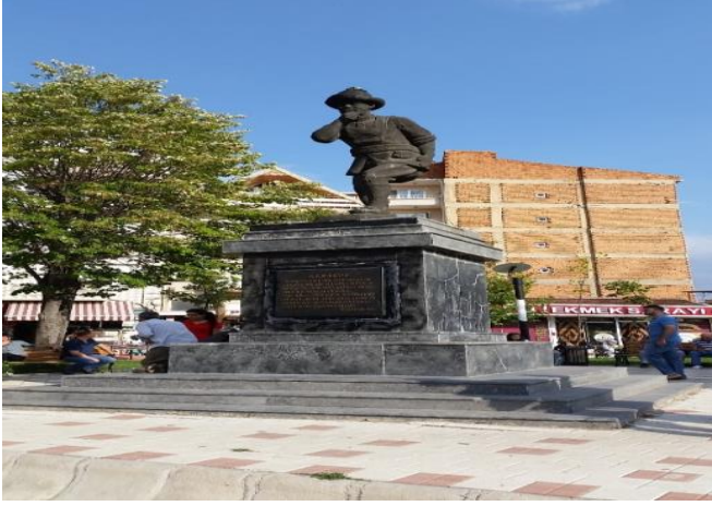
Resim 64: Karagöz Parkı / Çocuk Oyun Alanı (Karacaibrahim Mahallesi)