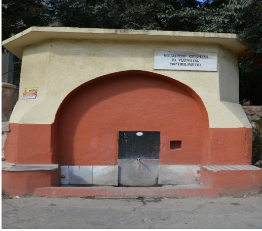
Resim 110: Kocahıdır Çeşmesi (Kocahıdır Mahallesi)