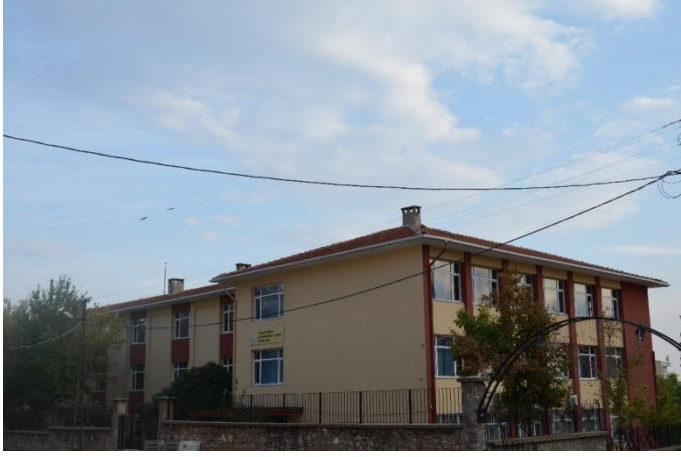
Resim 29: Kocahıdır Mesleki ve Teknik Anadolu Lisesi (Demirtaş Mahallesi)