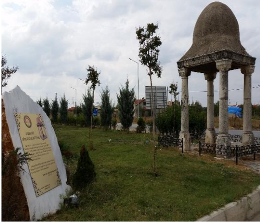
Resim 118: Dört Bacak Anıtı (Karahıdır Mahallesi)