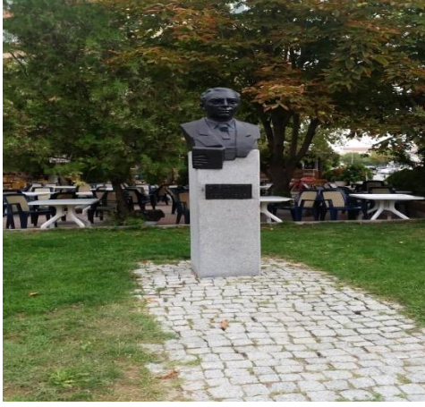
Resim 122: Sebahattin Ali Büstü (Karakaş Mahallesi)