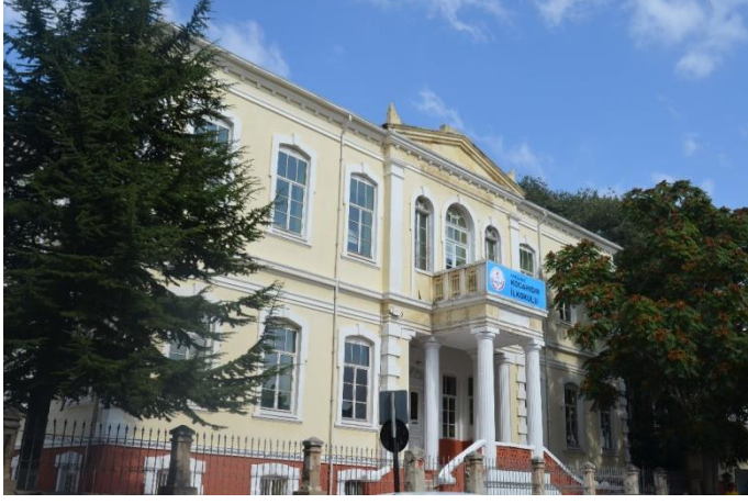
Resim 28: Kocahıdır İlkokulu (Kocahıdır Mahallesi)