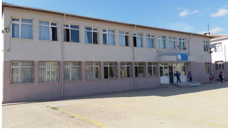
Resim 2: Ahmet Yener Ortaokulu (Pınar Mahallesi)