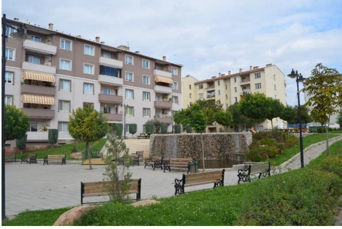
Resim 52: Cumhuriyet Parkı / Çocuk Oyun Alanı (Cumhuriyet Mahallesi)