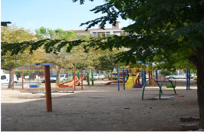
Resim 77: Yeşil Elma Çocuk Oyun Alanı (Karakaş Mahallesi)