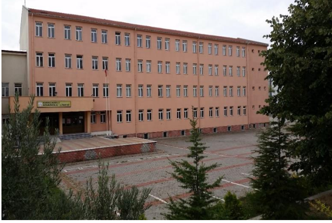
Resim 20: Kırklareli Anadolu Lisesi (Karakaş Mahallesi)