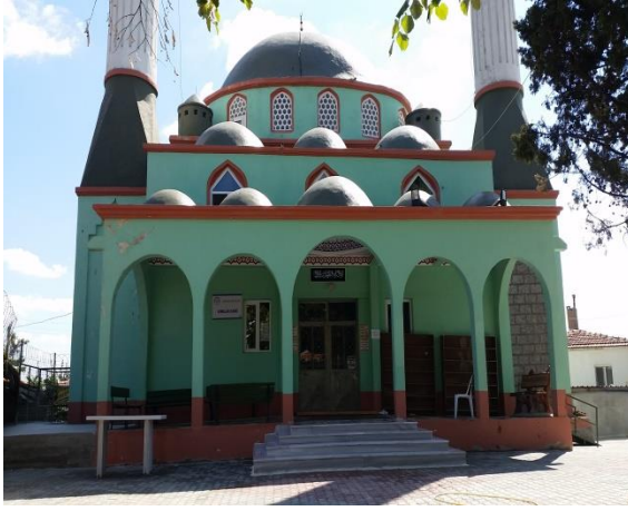
Resim 92: Kırklar Cami (Kocahıdır Mahallesi)