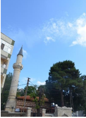
Resim 95: Sultan Beyazıd Cami (Kocahıdır Mahallesi)