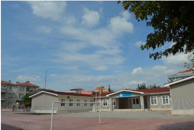
Resim 24: Kırklareli İmam Hatip Ortaokulu (İstasyon Mahallesi)