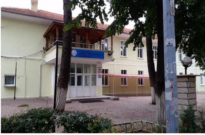
Resim 62: Hamdi Helvacı İlköğretim Okulu Bahçesi (Karakaş Mahallesi)