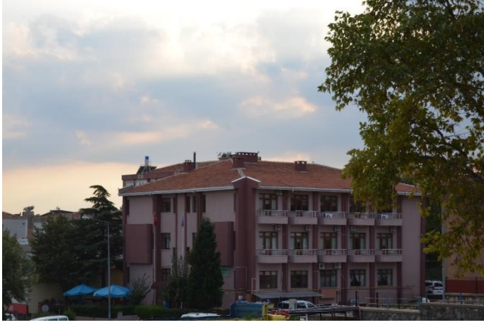
Resim 32: Öğretmenevi ve Akşam Sanat Okulu (Demirtaş Mahallesi)