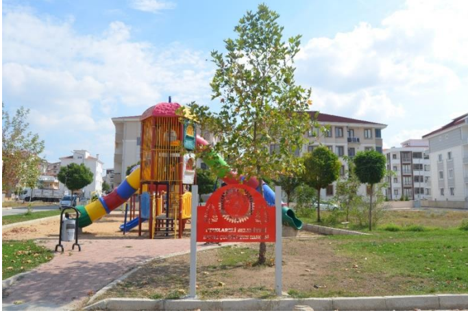
Resim 56: Defne Parkı / Çocuk Oyun Alanı (İstasyon Mahallesi)