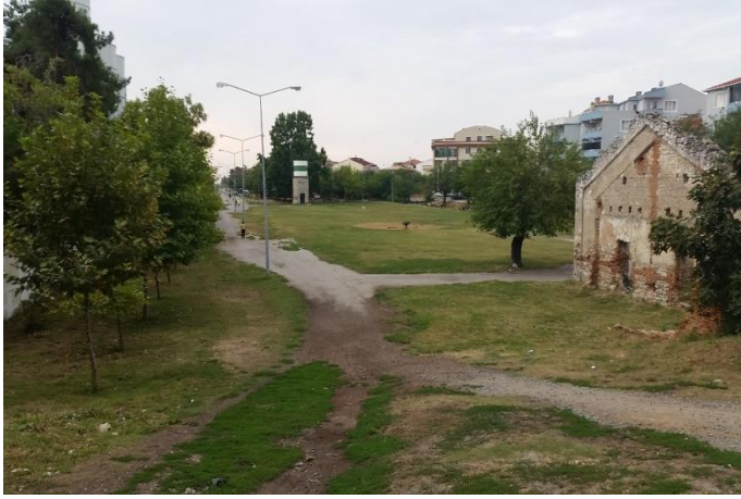
Resim 59: Festival Yeşil Alan (İstasyon Mahallesi)