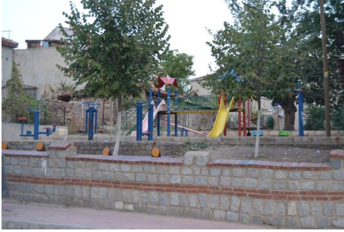
Resim 74: Taş Parkı / Çocuk Oyun Alanı / Spor Aletleri (Demirtaş Mahallesi)