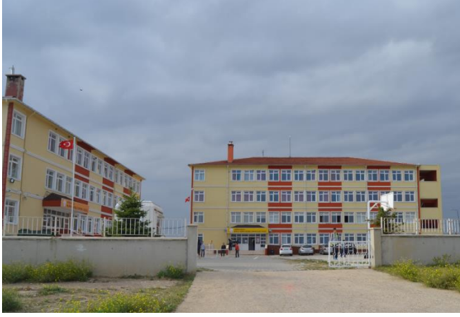
Resim 5: Bilal Yapıcı Güzel Sanatlar Lisesi(Kocahıdır Mahallesi)