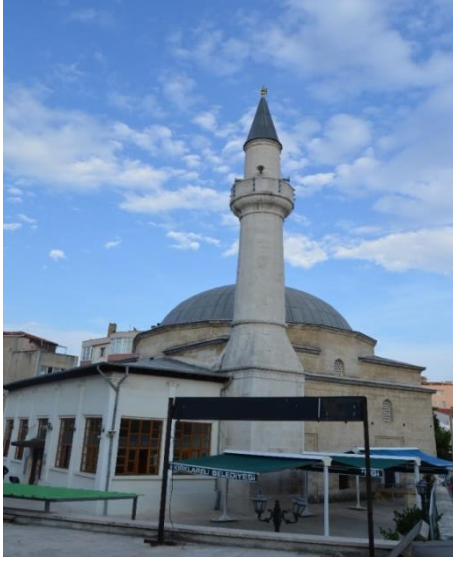
Resim 85: Hızırbey Cami (Demirtaş Mahallesi)