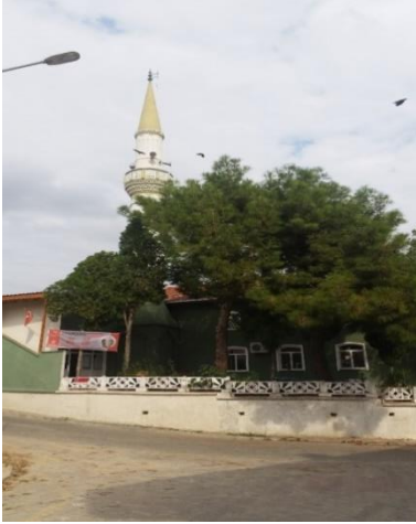
Resim 89: Karahıdır Mahallesi Cami (Karahıdır Mahallesi)