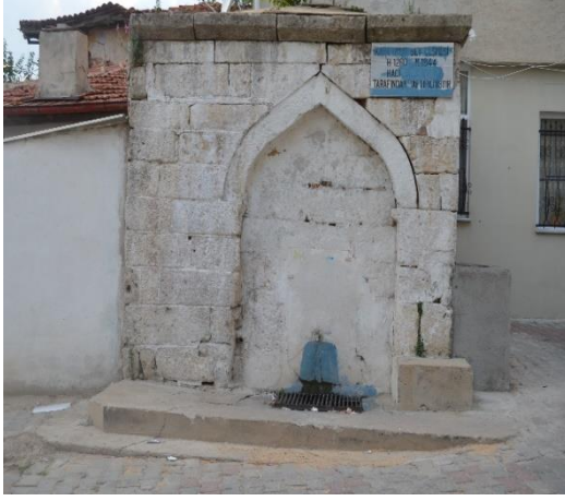
Resim 107: Karaumbey Çeşmesi (Demirtaş Mahallesi)