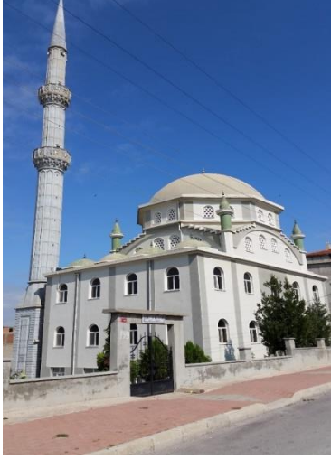
Resim 91: Kemal Canlı Cami (Akalar Mahallesi)