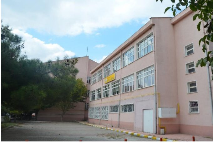
Resim 23: Kırklareli Fen Lisesi (Karakaş Mahallesi)