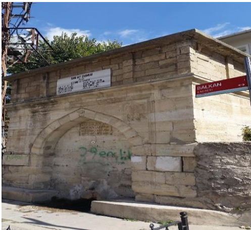
Resim 105: Kadı Ali Çeşmesi (Kocahıdır Mahallesi)