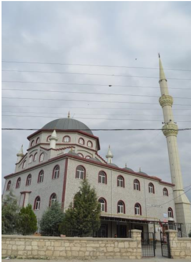
Resim 96: Sultan Reyhani Cami (Yayla Mahallesi)