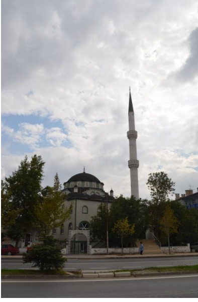
Resim 82: Bahriye Sultan Cami(Pınar Mahallesi)