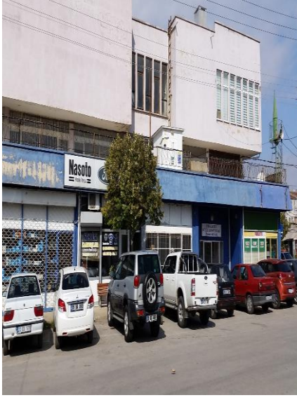
Resim 94: Sanayi Mescidi (Karacaibrahim Mahallesi)