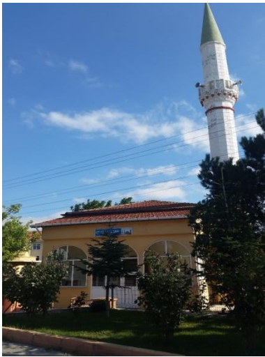
Resim 93: Köy Hizmetleri Cami (Pınar Mahallesi)