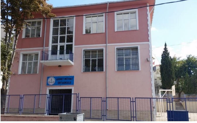
Resim 1: Ahmet Mithat Ortaokulu (Doğu Mahallesi)