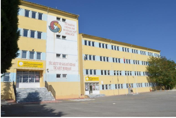
Resim 35: Türkiye Odalar ve Borsalar Birliği Anadolu Lisesi (Bademlik Mahallesi)