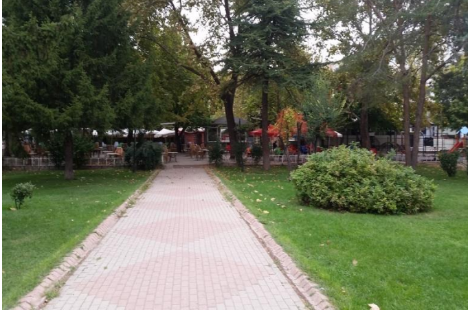
Resim 46: Atatürk Parkı (Karakaş Mahallesi)