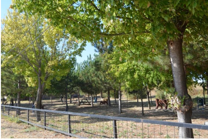
Resim 53: Çam Park / Çocuk Oyun alanı (Bademlik Mahallesi)