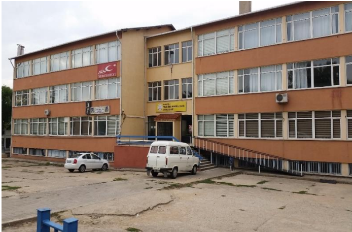
Resim 30: Mimar Sinan Mesleki ve Teknik Anadolu Lisesi (Karakaş Mahallesi)