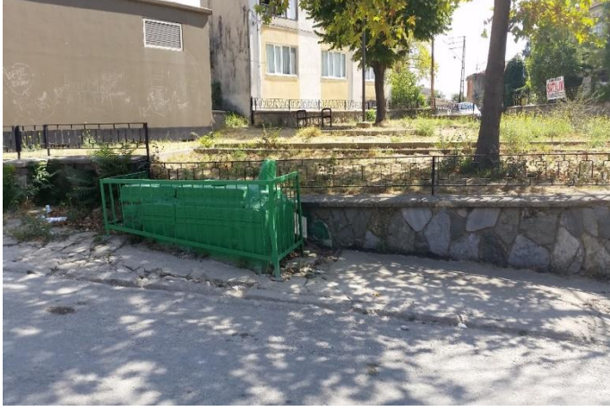
Resim 58: Ferah Park (Dođu Mahallesi)