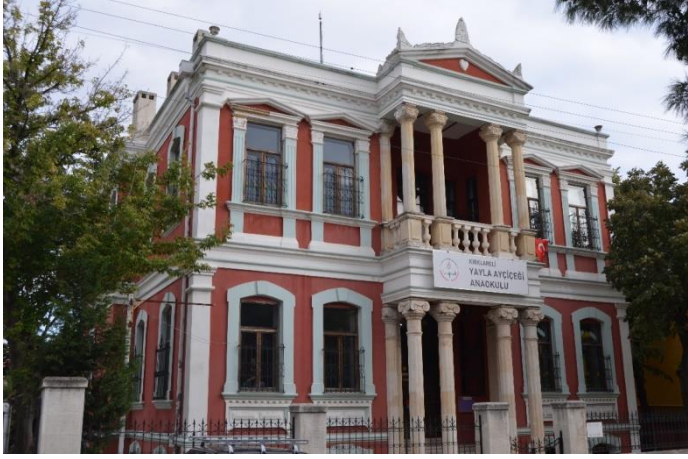
Resim 38: Yayla Ayçiçeği Anaokulu (Yayla Mahallesi)