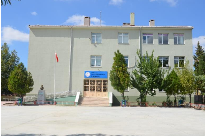
Resim 11: Gazi Osmanpaşa İlkokul (Bademlik Mahallesi)