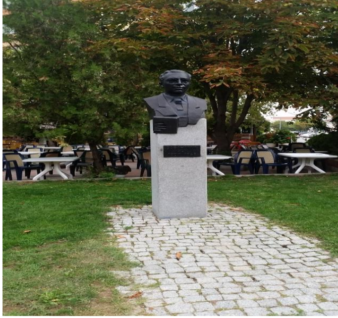
Resim 71: Sebahattin Ali Parkı (Karakaş Mahallesi)