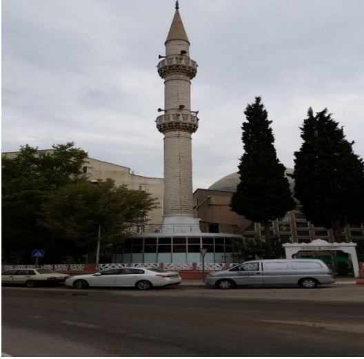
Resim 80: Ahmet Cevdet Paşa Cami (Karakaş Mahallesi)