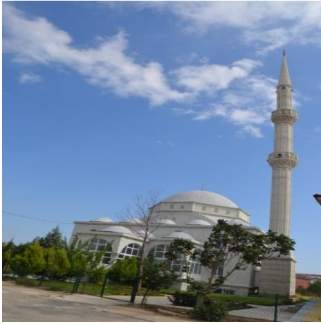
Resim 101: Yeni Sanayi Cami (Cumhuriyet Mahallesi)