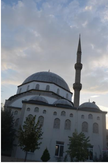
Resim 98: Timurtaşpaşa Cami (Demirtaş Mahallesi)