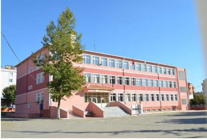
Resim 17: Kırklar Mesleki ve Teknik Anadolu Lisesi (Bademlik Mahallesi)