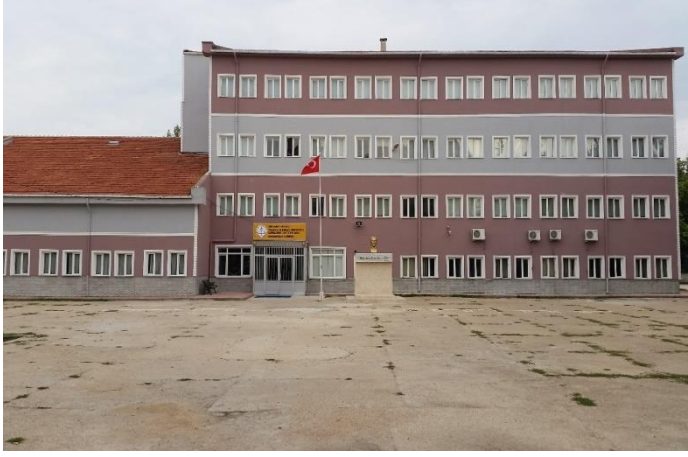
Resim 37: Yahya Kemal Beyatlı Mesleki ve Teknik Anadolu Lisesi (Karakaş Mahallesi)