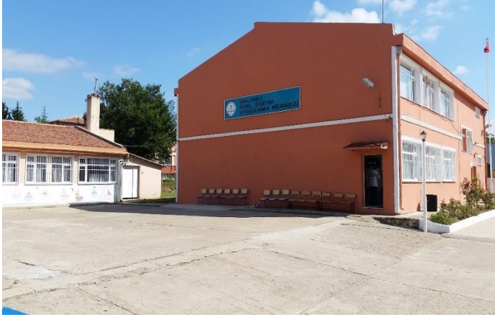
Resim 26: Kırklareli Özel Eğitim İş Uygulama Merkezi Okulu (Karacaibrahim Mahallesi)