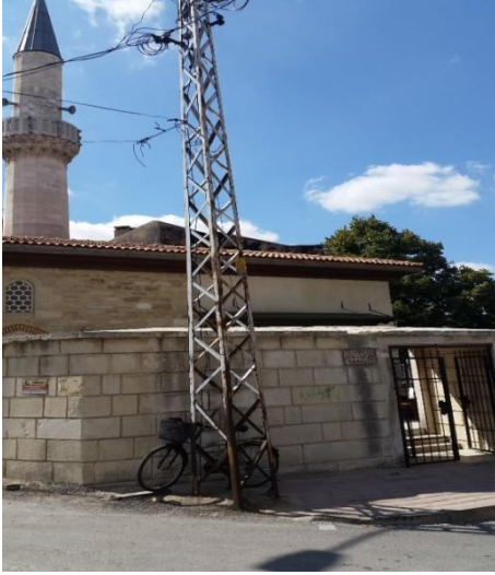
Resim 86: Kadı Emin Ali Çelebi Cami (Kocahıdır Mahallesi)