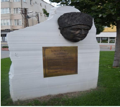
Resim 119: Fuat Umay Anıtı (Demirtaş Mahallesi)