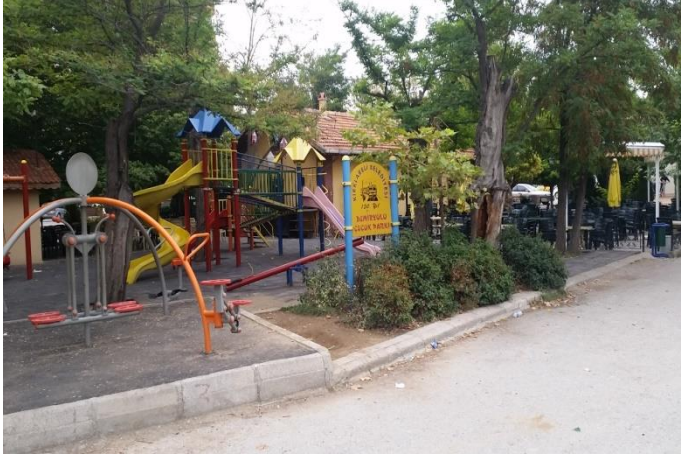
Resim 41: 150. Yıl Demiryolu Çocuk Oyun Alanı (İstasyon Mahallesi)