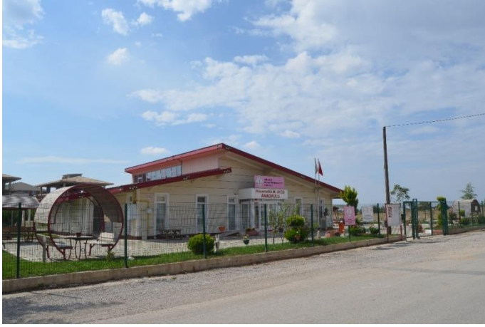
Resim 14: Hüsamettin Mehmet Ateş Anaokulu (İstasyon Mahallesi)