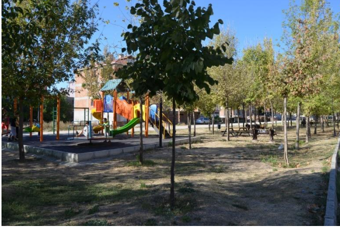
Resim 68: Nasrettin Hoca Park / Çocuk Oyun Alanı (Bademlik Mahallesi)