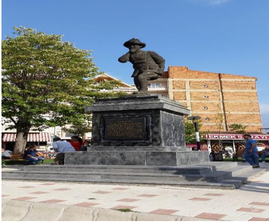
Resim 116: Karagöz Heykeli (Karacaibrahim Mahallesi)