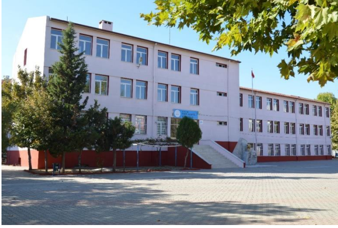
Resim 8: Fahri Kasapoğlu Ortaokul (Bademlik Mahallesi)