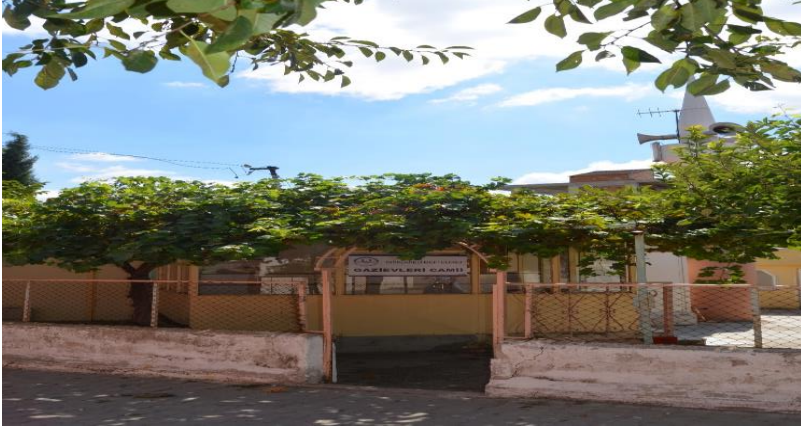
Resim 83: Gazievleri Cami (Bademlik Mahallesi)