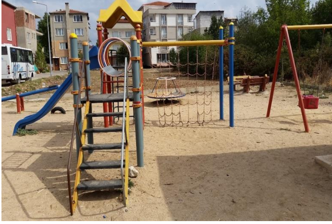
Resim 50: Barış Manço Çocuk Oyun Alanı (Karakaş Mahallesi)