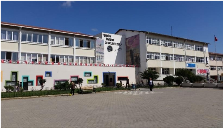
Resim 3: Atatürk İlkokulu / Ortaokulu (Karacaibrahim Mahallesi)