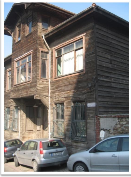
Örnek 1a- Onarım Öncesi