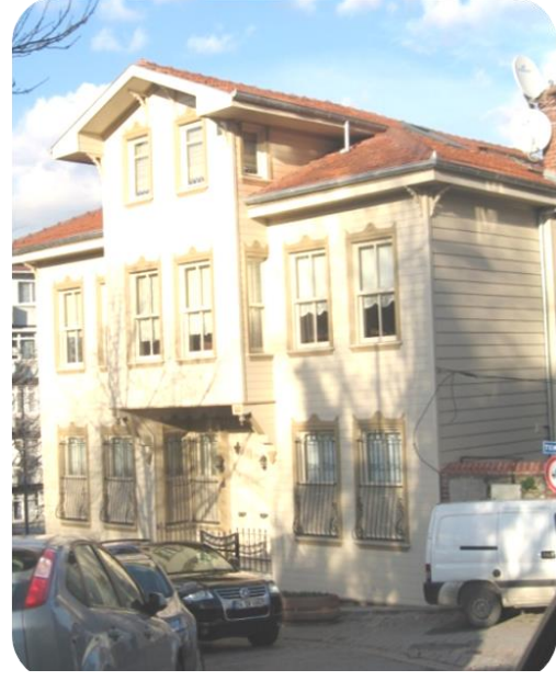
Örnek 1b-Onarım Sonrası

Başka bir sorunsu basit onarım kapsamında yıpranmış kapı pencere döşeme tavan vb. elemanların niteliğini ve taşıma gücünü yitirmiş olan bölümlerinin düzeltilerek kullanılabilir duruma getirilmesine izin verildiği halde genelde tamamen değiştirilerek yeni çerçeve, kapı üretimi yapılmasıdır. Bu durumun önüne geçilmesi ise ancak daha bilinçli bir toplum ve kalifiye eleman yetiştirme ile mümkün olacaktır.