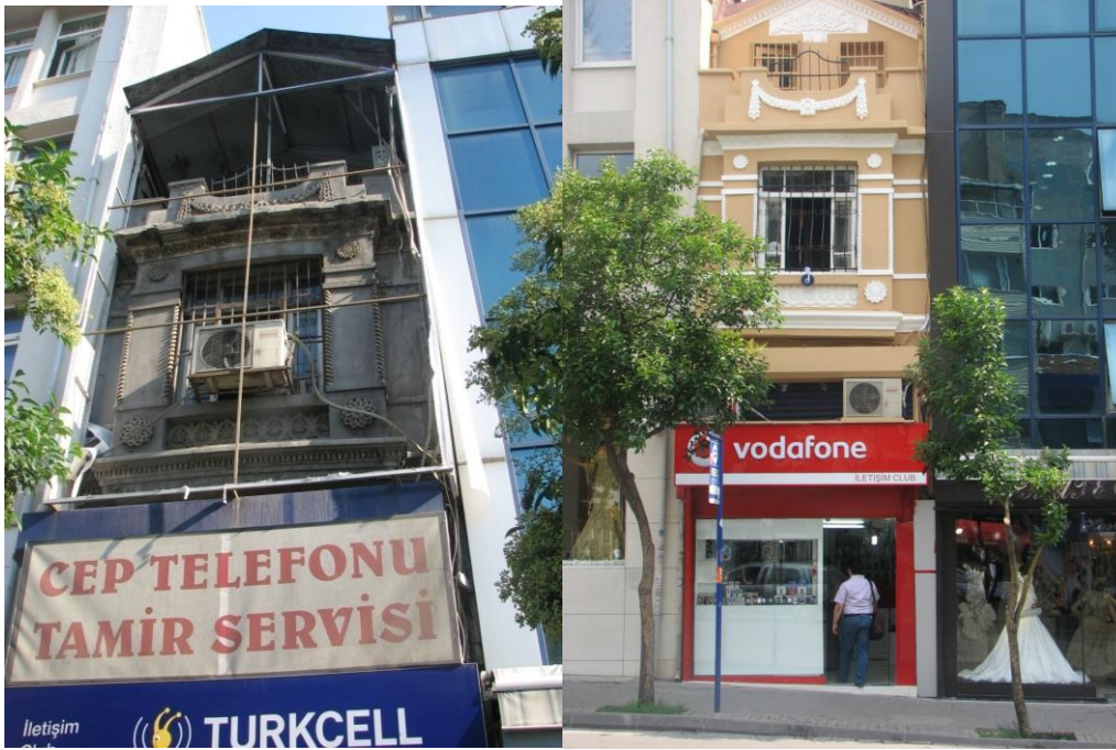
Örnek 2a Onarım Öncesi

Onarım izinleri ile bunlar bittikten sonra düzenlenen onarım uygunluk belge sayıları karşılaştırıldığında çok büyük bir fark olduğu görülmektedir. Onarım uygunluk belgeleri kişilerin aynen onarım izin belgesi alma gibi onarımı bitirdikten sonra başvurarak aldıkları bir belgedir. Hazırlanan onarım izin belgelerinde uygunluk için başvurunun zorunluluğu belirtilmekte olduğu halde başvuru alınmamaktadır. Ayrıca onarım bittiği anda, yapının değeri arttığı için el değişimi yaşanmaktadır. Yeni mülk sahibi ise bu raporu alması gerektiğinden genellikle habersizdir. Bu sorun başvuru beklenmeden uygunluk için değerlendirme yapılarak kurullara bilgi verilmesi şeklinde çözümlenmeye çalışılmaktadır. Başvurularda ise genelde uygunluk verilmesi zor olmaktadır. Çok güzel bir onarımda dahi ufak tefek sorunlar yada eksiklikler nedeniyle onarım izni verilememektedir. (Örnek 2a-b) Onarım, yapı tamamında eksiksiz tamamlanırken cephedeki klima kaldırılmadığı için onarım uygunluk düzenlenememiştir.