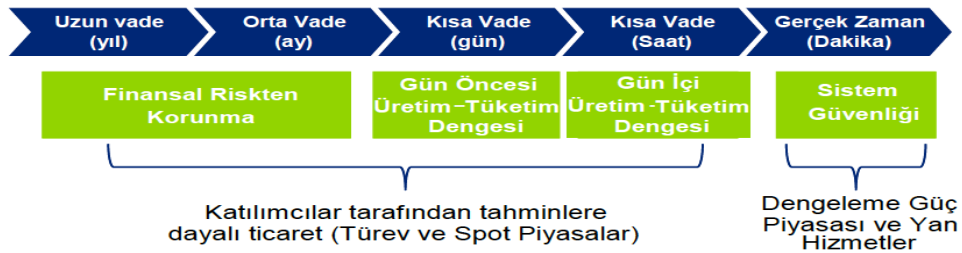
Şekil 1: Elektrik Piyasalarının Yapısı

Finansal piyasalarda spot ve vadeli işlem piyasası olmak üzere iki çeşit piyasa bulunmaktadır. Spot piyasalarda, belirli miktarda bir varlığın ve karşılığı olan tutarın el değiştirme işlemi genellikle birlikte gerçekleşir. Vadeli işlem piyasalarında ise anlaşma işlem tarihinde yapılmasına karşılık, gelecekte belirlenen vade gününde tarafların yükümlülüklerinin gerçekleştirilmesi öngörülür (İşler ve Utku, 2015, 184). Türkiye’de enerji piyasası spot ürünü olan fiziksel elektrik enerjisinin alım satımı EPIAŞ aracılığıyla yapılmaktadır. Vadeli işlem olarak elektrik enerjisinin dayanak varlık gösterildiği elektrik vadeli işlem sözleşmeleri ise Borsa İstanbul’da işlem görmektedir.