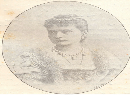
Resim 3. Aleksandra Fyodorovna (Âlem-i Nisvân, Tanıtım sayısı, 1905)