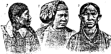
آسیاده یشابان مازندول قادیئری (اسمیری رنگلی)

Nigâr Hanım'ın şiirleri Efsûs, Nirân, Aks-i Sâdâ, Safahât-ı Kalp serlevhalarıyla cem' ve neşrolunmuştur. " şeklindedir. 35 Nigâr Hanım'ı tanıtan bu yazının mecmuadaki pek çok yazıda olduğu gibi yazarı belirtilmemiştir. Ancak biz bu bilgilerin Abdullah Sur'un Füyûzât (Bakü) mecmuasında 1907'de yayımlanan " Bir Türk Şairesi " başlıklı makalesinden alıntı olduğunu düşünüyoruz. Yine aynı şekilde " Kadında İlim ve Marifet " 36 başlıklı ve A. Tevfik Efendizâde imzalı yazının da Sur'un kaleminden çıkmış olması muhtemeldir. Nitekim Abdullah Sur'un çeşitli matbuat organlarındaki yazılarında A. Sur, soyadı olan Mehemmedzâde, A. Tevfik, Genceli, Abdullah Mehemmedzâde, Bir Adam gibi adlar kullandığını biliyoruz. 37