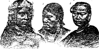
آفریقاده یشابان حبش قادیئاری (سباهجه رنگلی)

Resim 6. I. Sıradakiler Asya'da yaşayan Moğol kadımları. II. Sıradakiler Afrika'da yaşayan Habeş Kadımları. (Âlem-i Nisvân, Sayı 4, 24 Mart 1906)