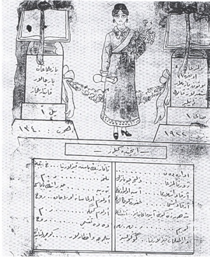
Resim 2. Nenkecan mecmuası kapak sayfası. (Nenkecan, Sayı 1, 1922)

Hatice Hanım gazetesinden Âlem-i Nisvân'a hayli şeyler nakledeceğiz. Neler yazıldığını neler arzu edildiğini görürsüz.” 25