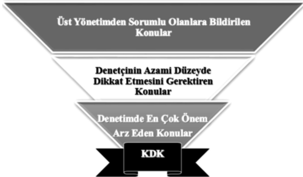
Şekil 1. Kilit Denetim Konularının Belirlenmesi

Kaynak: IAASB, International Auditing and Assurance Standards Board), Determining and Communicating Key Audit Matters (“KAM”) ve (Doğan, 2018, 67).