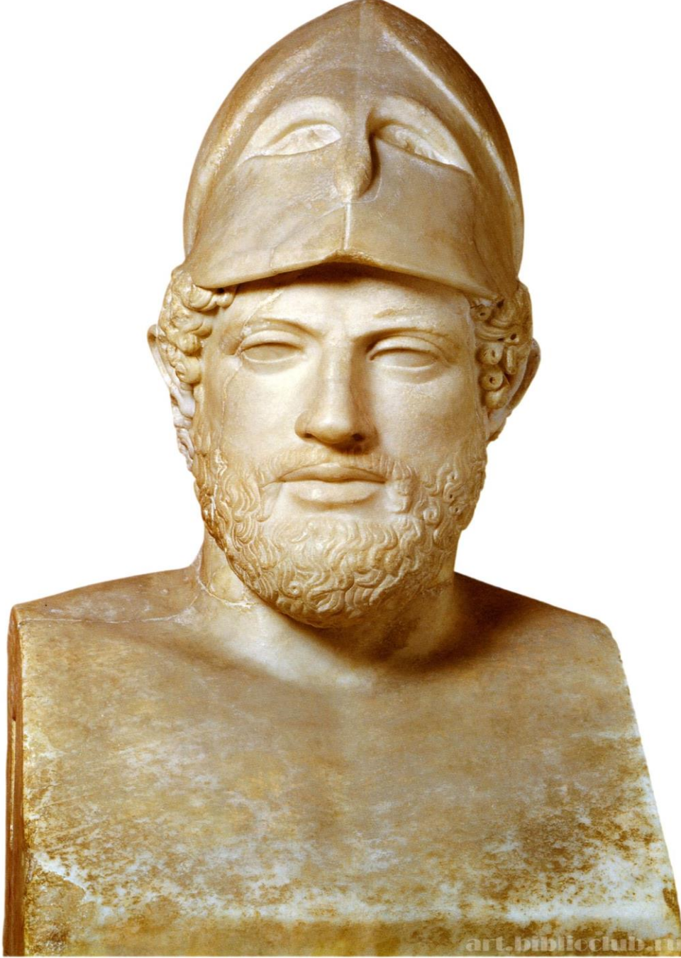
EK 1: Perikles'in Migferli Heykeli